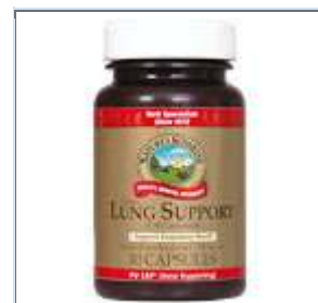
LUNG SUPPORT TCM (30) No. de Stock: 1004-3 Costo: $24.00

NOTA: Las embarazadas o que dan de lactar deberán consultar con su proveedor de la salud antes de tomar este suplemento. Tome 2 cápsulas diarias con las comidas.