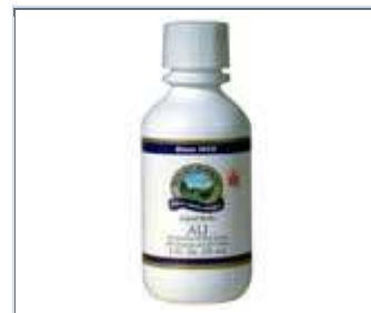
ALJ LIQUID HERB(2 FL OZ) No. de Stock: 3166-5 Costo: $16.00

Tomar de 2 a 4 cápsulas/tabletas cada 2 a 4 horas; si usa el líquido, tomar de 20 a 30 gotas (niños: 10 a 20 gotas) con agua, cada 2 a 4 horas.